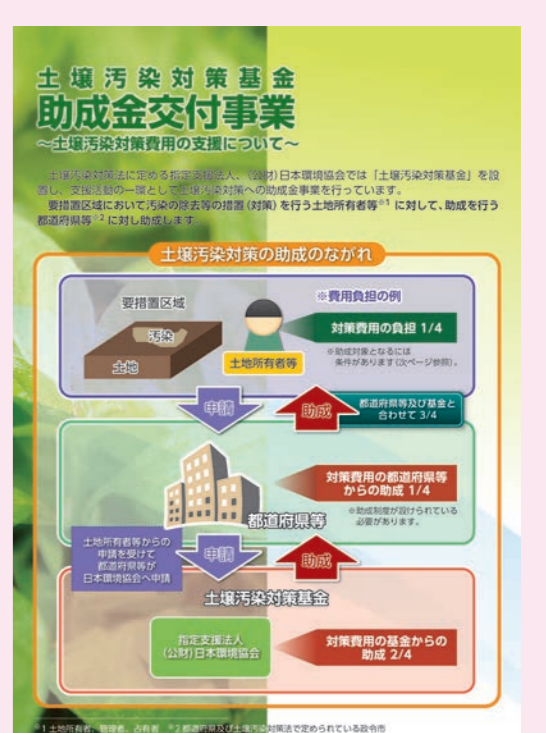
土壌汚染対策制度に関するパンフレット