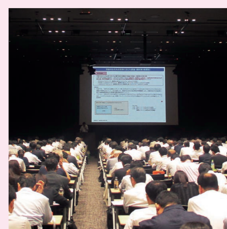
セミナー開催の様子

そのような方に、日本環境協会では、 毎年無料セミナーを開催しています！ 無料で専門の講師を派遣しています！ 土壌汚染対策法などに関するパンフレットを無料で配布しています！（送料のみご負担いただいております）